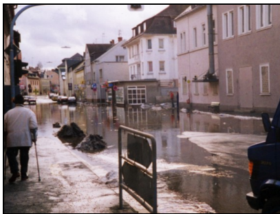
Hochwasser 2004 – Hofer Straße