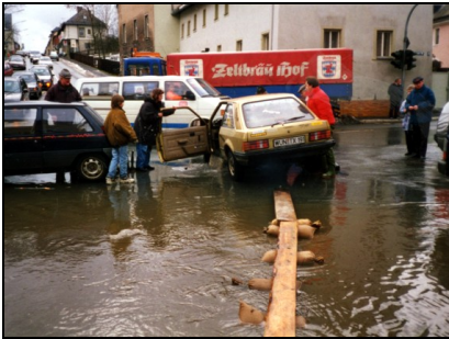
Hochwasser 2004 – Kreuzung

Die Überflutungen verursachen dabei erhebliche Schäden an Wohngebäuden, Industrie- und Gewerbegebieten, sowie öffentlichen Einrichtungen und führen zu Beeinträchtigungen im innerörtlichen Verkehrsgeschehen.