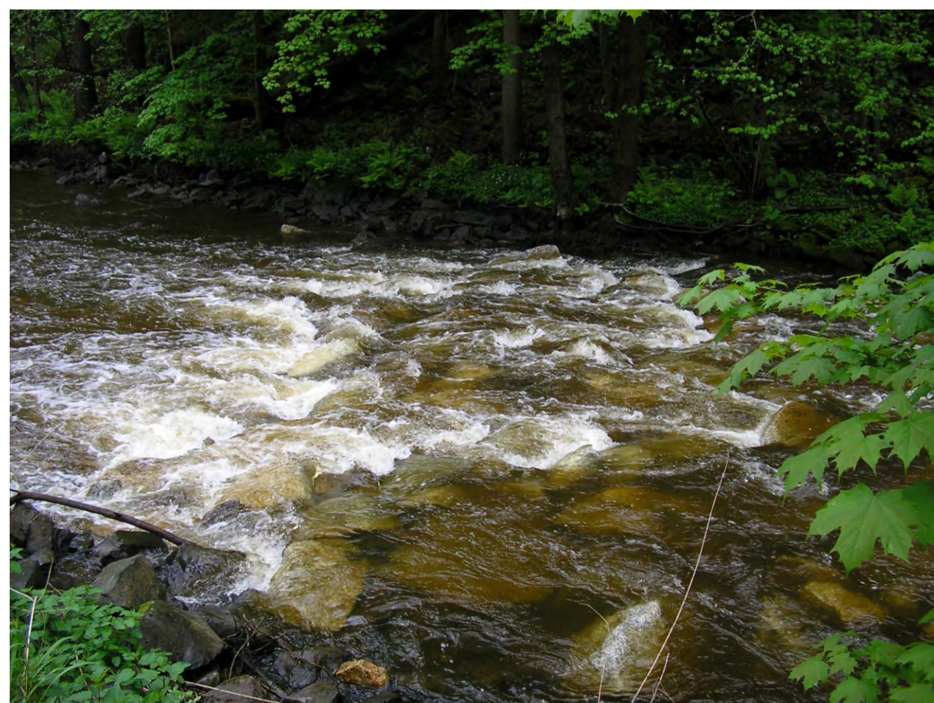
▲ Nach den Umbau

Bei der Nagelfabrik Künzel an der Röslau wurde im Jahr 2006 eine bestehende Betonschwelle durch eine Sohlgleite als Tierwanderhilfe ersetzt.